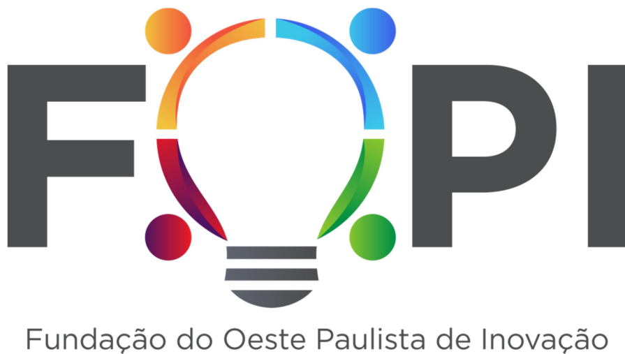
Figura 1 – Logomarca da FOPI

A logomarca da FOPI foi criada em fevereiro de 2021. Consistiu em uma primeira atividade, pois, ao ver da diretoria, constitui a base de todas as ações previstas para o referido período. A ideia era remeter a logomarca aos objetivos principais da fundação que envolvem incentivo a educação, a pesquisa e a inovação, por meio de agentes parceiros, sejam eles academia, empresa e/ou governo (Figura 1).